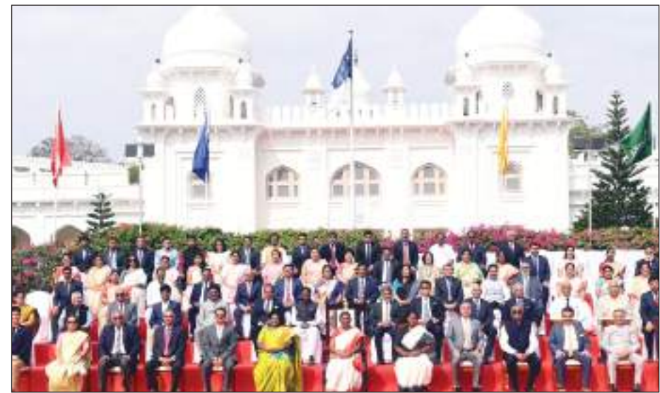
भारत की राष्ट्रपति द्रौपदी मुर्मू हैदराबाद में हैदराबाद पब्लिक स्कूल के शताब्दी समारोह में शामिल हुईं।

ने कहा कि यह पहली बार है जब देश में 141 संसद सदस्यों को निलंबित किया गया है। यह गलत है, हम इसके खिलाफ लड़ेंगे। हम इसके खिलाफ लड़ने के लिए एकजुट हुए हैं। हमने 22 दिसंबर को सांसदों के निलंबन के खिलाफ विरोध प्रदर्शन करने का फैसला किया है।